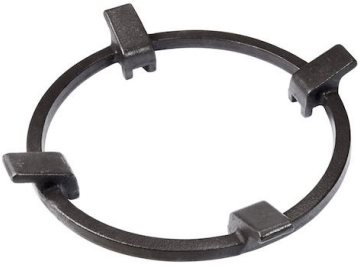
Support de Wok en fonte